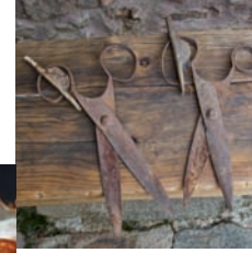
Tijeras de esquilador

Las migas de pastor era el plato de la mañana. Queso con pan a mediodía y una sopa con carne por la noche completaban la dieta diaria.