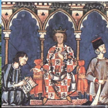
Alfonso X el Sabio

Diez grandes ejes, llamados cañadas reales, surcan la península de norte a sur. El Fuero Viejo decía que debían “ser tan anchas que encontrándose dos canes (perros), pasen sin embargo”, con la Mesta medirían 90 varas castellanas (unos 75 m). Las cañadas se intercomunicaban gracias a los cordeles de 45 varas, las veredas de 25 varas y las coladas de menor amplitud. Una ley de 1995 protege este rico patrimonio ecológico y cultural frente a las agresiones y usurpaciones.