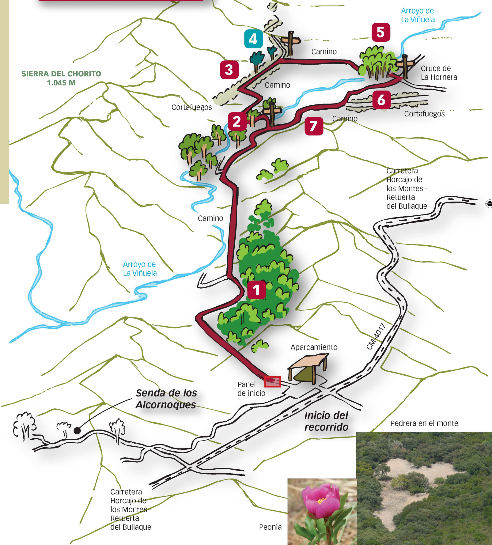
Brezales con alcornoques